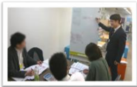
札幌市、北広島市などで 販売・流通に関する講座を開催