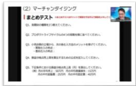
オンラインでの販売士講座提供 (パナソニック マーケティング ジャパン様など)

多くの販売士を輩出してきた札幌販売士協会による講習会。 本講座で1つで販売士資格合格を目指せるオールインワン講座です。